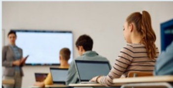
Toetsen en examineren