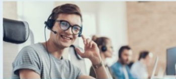
Combineren en arrangeren van leermateriaal