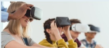
Verwerven en in gebruik nemen van digitale leermiddelen