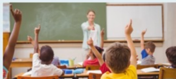
Evaluëren leervoortgang en -resultaten